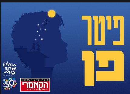
זוכה פרס ישראל הקאמר התאחדות הילדים